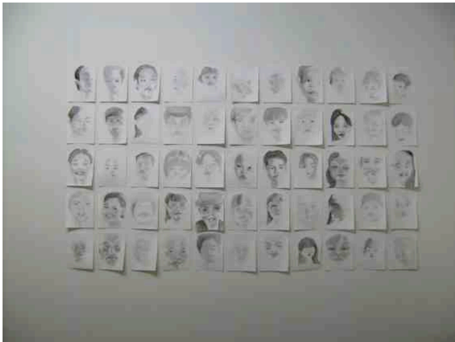
Untitled/Aquarell, 2007-2010 Watercolour on paper, 28 x 20,8 cm each