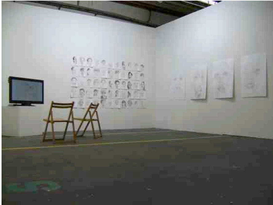
Kunst Zürich – ZKB Kunstpreis 2010 Installation View